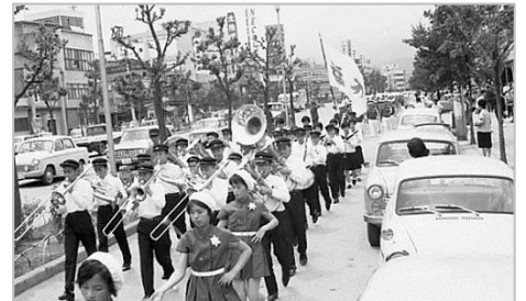
▲国体出場選手市内パレード 昭和39年 61967